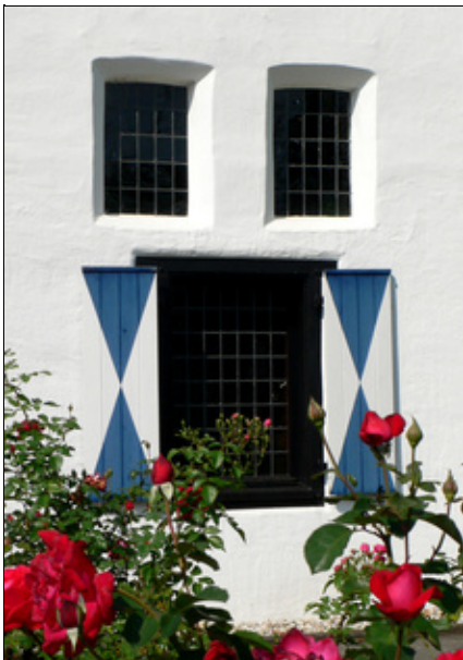
Geldern ? Die Landlebenstadt