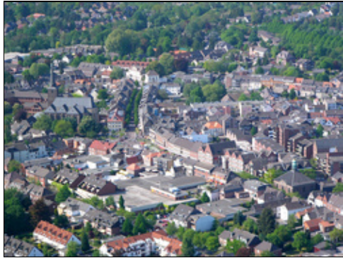
Geldern aus der Vogelperspektive