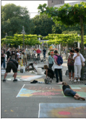
Straßenmalerwettbewerb in der Innenstadt